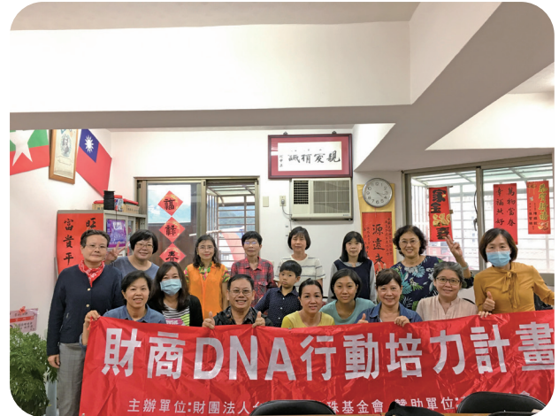
9月30日與中華民國緬甸歸僑協會合辦幸福理財帳本第86期結業式。