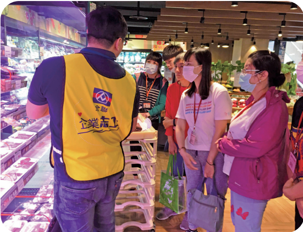
7月10日全聯提供職場體驗機會，讓新移民婦女認識全聯的工作內容和福利制度，並提供現場面試。