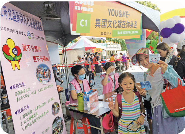
8月6日參與中山社福中心主辦「2020大手牽小手，友善Fun心遊」園遊會設攤。