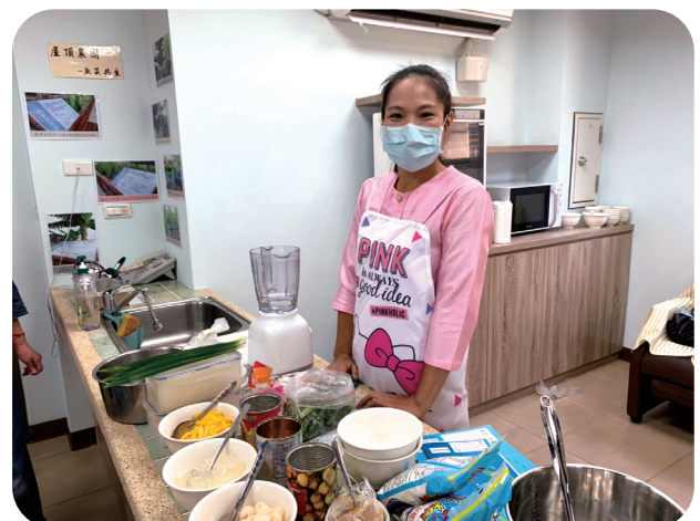
9月18日展珍心愛公益活動邀請泰國講師教學製作摩摩喳喳。