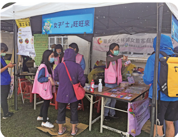
10月18日參加士林區公所「2020士林國際文化節」設攤宣導。