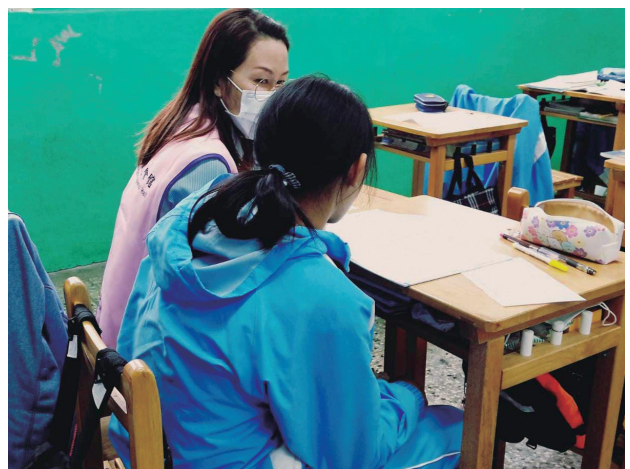
通譯在學校中進行服務。