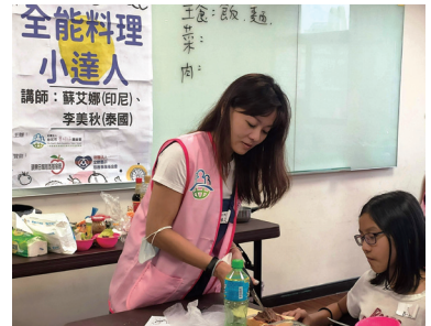
講師教導如何做出美味的家鄉料理。

在本會的活動中，除了社工和工作人員外，志工的參與也給予我們最大的幫助。本會志工夥伴組成的層面很廣泛，有退休人士、在職人士、學生、新移民姐妹，更有本會的認養人，大家都熱心公益服務不遺餘力。感謝每位志工在一次又一次的服務中，與我們陪伴及見證孩子們的成長。