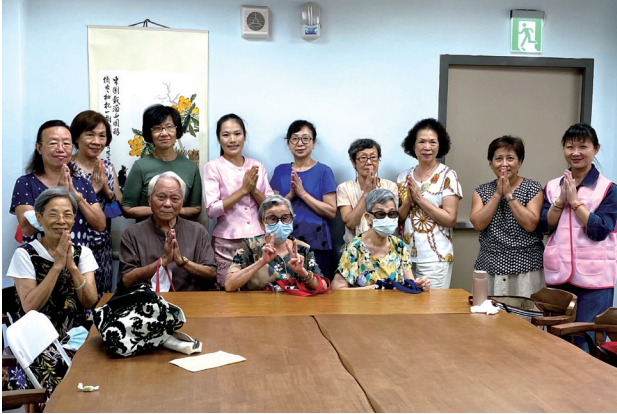
感謝志工團隊成為我們的助力。

「展珍新 愛公益」為本會受臺北市政府社會局委託辦理之臺北市北區新移民社區關懷據點的特色方案之一，聚集了對於公益活動有興趣的新移民，透過分享母國的特色美食、童玩，讓民眾有機會更深入認識異國文化，並讓新移民以自己的母國文化為傲。