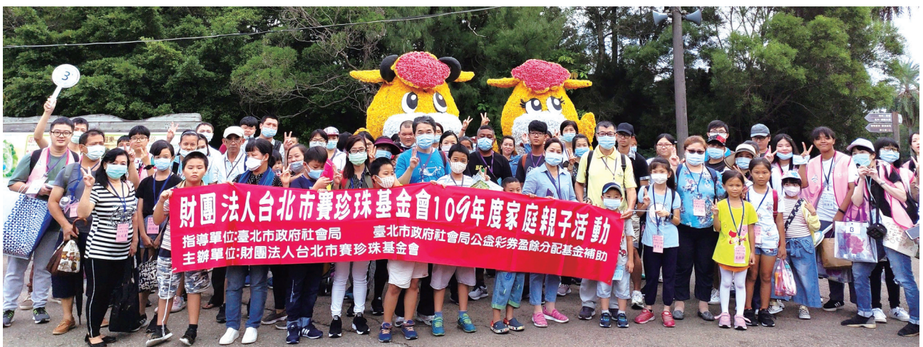
一年一度的親子一日遊。