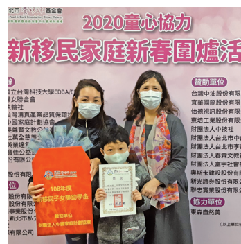
2020童心協力執行長(右)頒發獎助學金給本會孩童。

教育與學習是孩子成長的重要歷程，本會期望藉由助學金的獎勵，讓分數進步的孩子體察學習的樂趣；藉著獎學金的鼓舞，讓成績優異的孩子獲得學習的成就。期許能邀請您加入捐助獎助學金的行列，一起榮耀孩子學習的心。