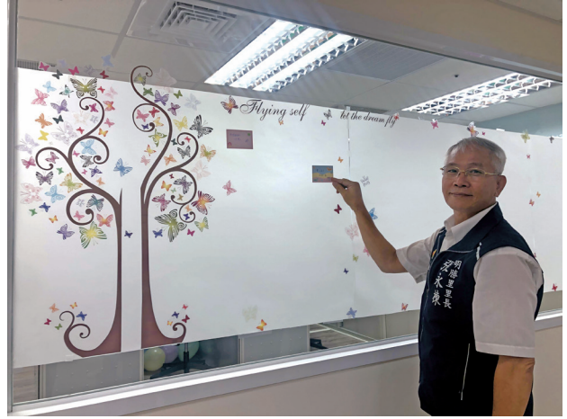
「許願樹」寫下對中心之期許。

在茶會之後，繼而登場的是「志工訓練」，志工隊是我們未來將努力發展的方案，培力志願服務者，一起為士林區的家庭提供服務，現有18名的生力軍，有志工隊長、隊長助理與我們一起慢慢壯大志工隊，打造本中心強大志工團。