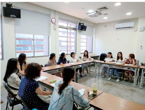
需要經過完成專業培訓課程並通過考試，才能成為合格的通譯人員。