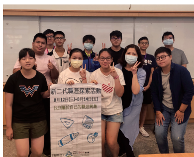
孩子們開心參與職涯探索活動。

暑假期間，本會辦理新二代職涯探索活動，帶領青少年們到傳統的汽車、襪子產業職場進行參訪，也到廣告設計、咖啡廳等場域和職人進行討論，更邀請本會青少年技能培力的大學長來分享從事餐飲相關的學習與從業經驗。除了瞭解到不同行業的工作內容及性質，也讓他們對於未來有更多的想像與思考。