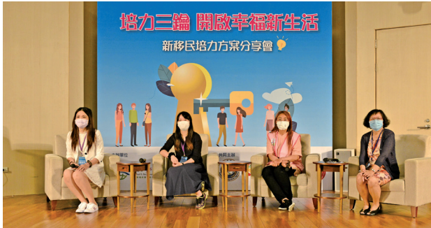
「新移民培力方案分享會」以培力角度探討新移民之需求。

本會自2012年起，以「新移民女性金融能力發展行動計畫」獲得國際花旗基金會贊助長達8年，共同推動理財教育，協助新移民及經濟弱勢族群建立規畫與運用金錢的能力。其中主軸方案為「幸福理財帳本」，讓學員學習到記帳、設定預算及基礎金融知識，並將所學運用在生活當中，至今上課學員已逾1,600位，課程期間累積儲蓄金額達3,300多萬元。